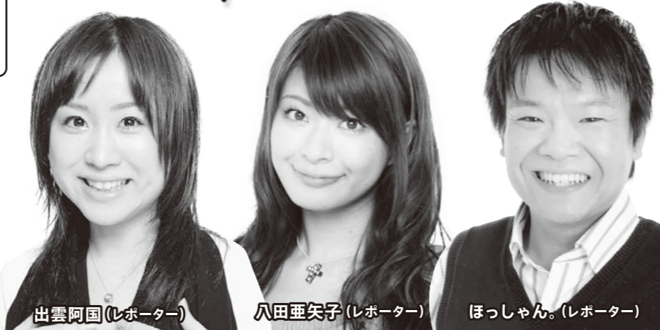
出雲阿国(レポーター)