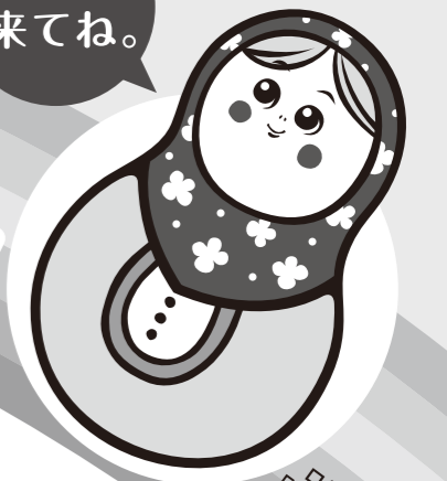
ロシア代表 「マトちゃん」