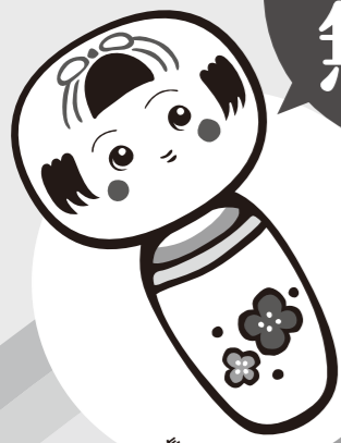
日本代表 「コケちゃん」